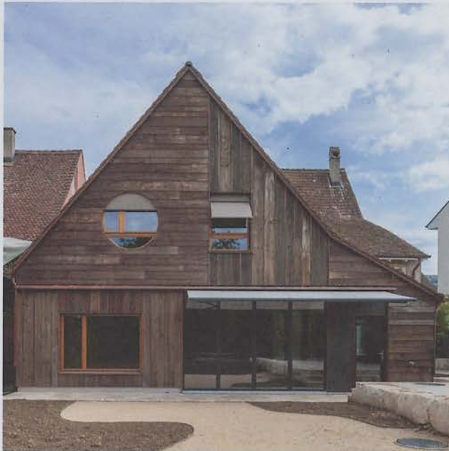
6.1 Ansicht Nordwest 2020

Zusammen mit den Architekten hat sich die Bauherrschaft dazu entschieden, einen möglichst grossen Teil des Bestandes zu erhalten: «Altes wertschätzen und sanft transformieren», lautete das Credo. So wurde viel Wert darauf gelegt, die reiche Zimmermannskonstruktion weiterhin erlebbar zu machen. Die wenigen sichtbaren Eingriffe im Gebäudeinneren treten in einen Dialog mit der Substanz.