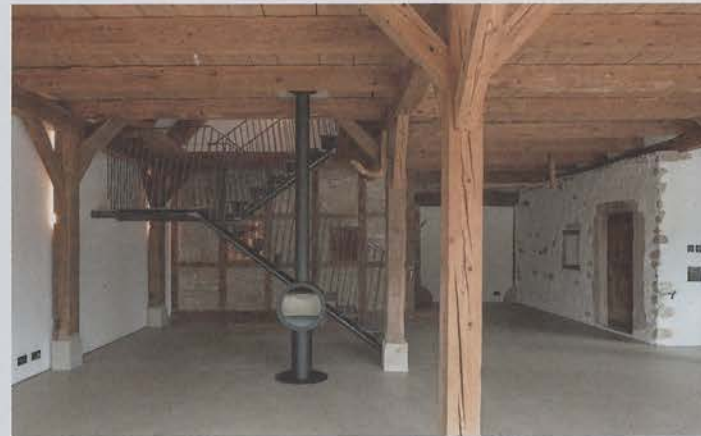
6.3 Wohn- und Essbereich im Erdgeschoss