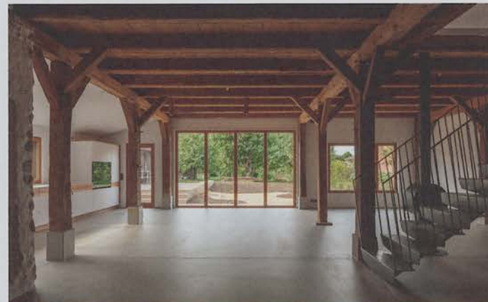
6.4 Wohn- und Essbereich im Erdgeschoss